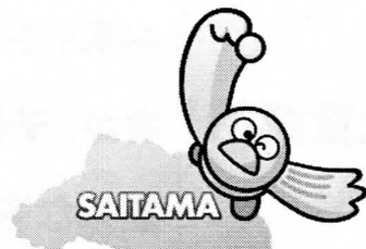
彩の国マスコット 「コバトン」

児童福祉担当課(子供についての相談) 保健センター (子育てなどの相談) 教育委員会 (子育てなどの相談)